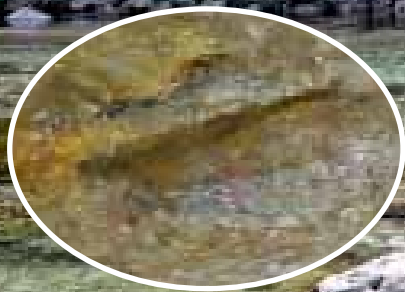
Fischen auf Sicht im glasklaren Wasser – Spannung pur

Überraschung. Buschige Fliegenmuster wie Caddis oder Stimulator fischen sehr gut. Fressen die Fische nur selektiv, versuchen Sie es mal mit kleineren Mustern. Seit Jahren werden neben Bachforellen auch vermehrt wieder die heimischen Marmoratas besetzt und wachsen gut ab. Jedes Jahr fangen die Fliegenfischer Exemplare bis zu 70 Zentimetern Länge! Das Auffangbecken, rund 400 Meter vor dem Bacheinlauf in den Zoggler-Stausee ist einer der langsamsten Flussabschnitte und ein beliebter Platz. Hier ändert sich das Bild des Baches und erinnert eher an einen Kreide-Fluss. In und zwischen den Krautfahnen finden die Fische optimalen Schutz und einen gedeckten Tisch.