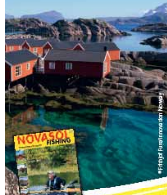
• Frithjof Fure/Innove from Norway